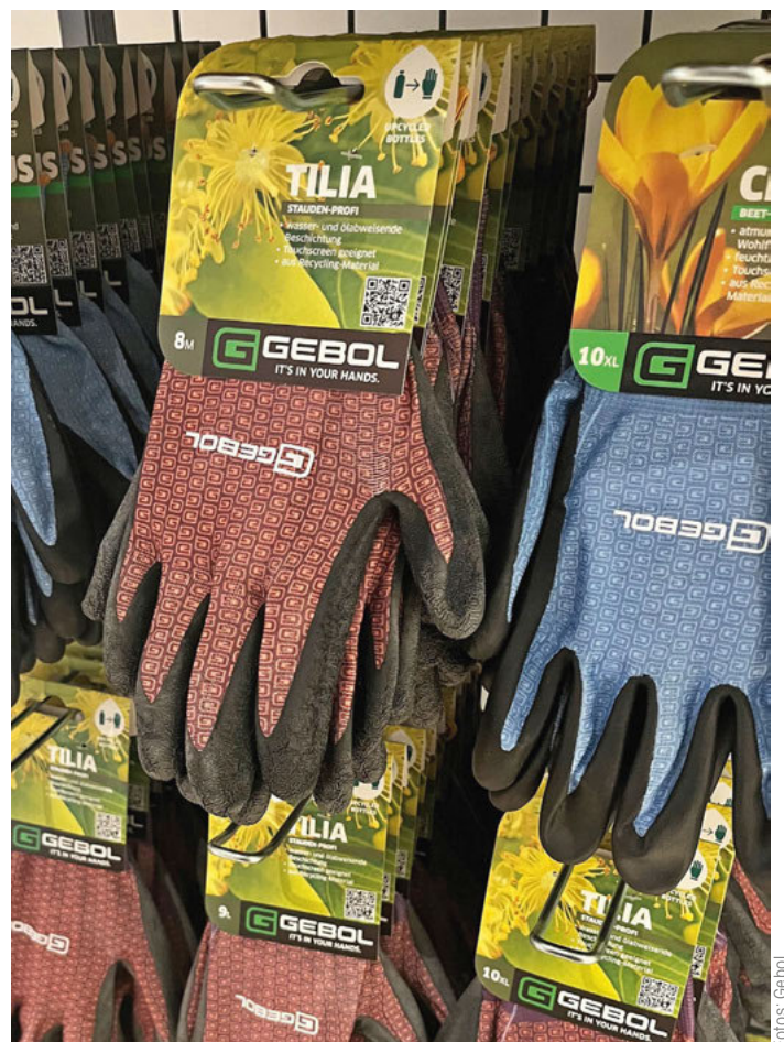
Der Recycling-Anteil bei Gartenhandschuhen wird nicht mehr in den Vordergrund gestellt, da das Gebol als Standard ansieht.

Im Garten-Sortiment bietet Gebol auch ein Mini-Me-Prinzip an: für jede Art von Handschuh gibt es eine Kindervariante. „Wie der Papa oder die Mama, so auch der Sohn oder die Tochter – so können Kinder von klein auf auch aktiv in den Garten eingebunden werden“, befindet Schrader. ■